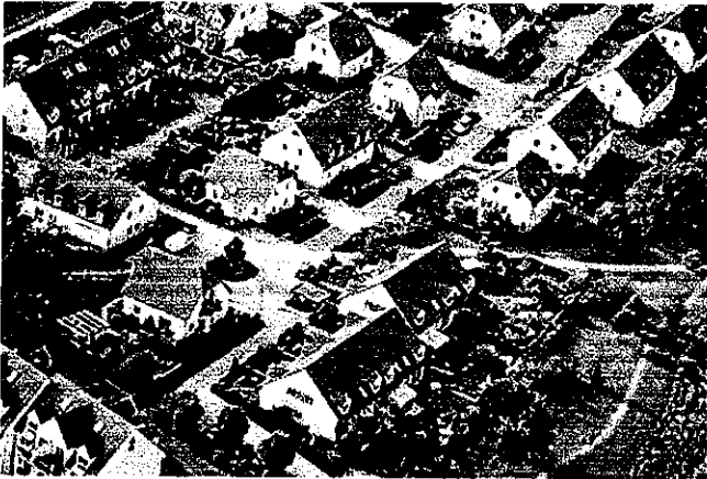
Der Sonnenwinkel in Ahrensfelde: Erbbaurecht ist nicht sorgenfrei.

Die Vertragsdauer ist nicht gesetzlich vorgeschrieben. Häufig findet sich eine Vertragsdauer von 99 Jahren, doch gibt es Verträge mit einer Dauer von nur 60 Jahren. Bei Abschluss dieser „kurzfristigen“ Verträge war man sich über die Konsequenzen nicht im Klaren. Erstens konnte niemand in den 50er und 60er Jahren erwarten, dass die Grundstückspreise in den Folgejahren extrem ansteigen werden, zudem erhöhte sich die Lebenserwartung der Bundesbürger. Bei Abschluss kurzfristiger Verträge ging man also von stabilen Grundstückspreisen aus, der Berechnungsbasis des Zinses, von denen auch die zweite Generation noch profitieren würde. Doch gibt es heute über achtzigjährige Erbbaurechtsnehmer, deren Vertrag nach 60 Jahren ausgelaufen ist. Ein neuer Vertrag ist fällig, für den vier Prozent des nun aktuellen Grundstückspreises verlangt werden. Dies können 400 Euro im Monat sein – und die finanziellen Möglichkeiten des Erbbaurechtsnehmers übersteigen. Zu fordern sind bei neuen Verträgen eine Mindestdauer von 80 Jahren sowie die Verlängerung kurzfristiger Altverträge bis auf 99 Jahre, und zwar auf der alten Basis der Erbbauzinsberechnung. Der Problematik, dass zum Beispiel Kommunen, die unter Haushaltsaufsicht stehen, nicht auf Einnahmen verzichten dürfen, kann der Gesetzgeber abhelfen, indem er eine Verlängerung kurzfristiger Erbbaurechtsverträge bei Vorliegen sozialer Gründe zu den alten Vertragsbedingungen gestattet.